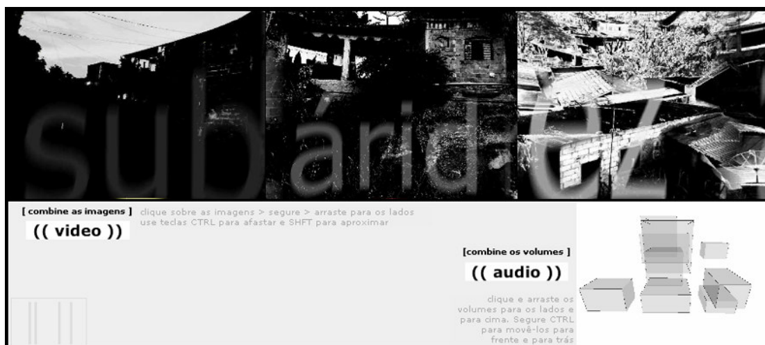
FIGURA 30 - Imagem da constituição possível dos elementos visuais na IDVA#3. Aspecto visual da IDVA#03.

A sucessão de imagens panorâmicas buscou oferecer ao usuário uma experiência de percurso a partir de diferentes velocidades de transição das imagens associadas aos registros sonoros da rodovia. A interface procurou explorar a capacidade de reposicionamento do usuário diante das diferentes realidades que a ele é apresentada, propondo uma experiência temporal múltipla e dinâmica de apreensão. Com relação aos conceitos apresentados na interface, sua visualização fragmentada e independente faz com que a experiência do texto seja como a de uma imagem. Entretanto, na medida em que se combinam prefixos, radicais e sufixos gerando palavras, a interface demanda um outro nível de interpretação da ordem dos significados conceituais, que busca instigar possíveis definições ou reinvenções tais como: trans_arid_ismo , des_acab_ado , hiper_esteril_ez . Considerando que a relação interativa deve oferecer possibilidades de construção de um percurso crítico a partir de interpretações particulares de um conteúdo não-linear, a problematização pode ser potencializada no momento em que o usuário se “esbarra” com aspectos incertos e sem significado imediato. Neste ponto, surgem aberturas para que ele deposite uma bagagem crítica pessoal para elementos que demandem definições.